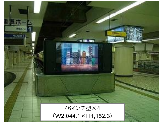
46インチ型 × 4 (W2,044.1 × H1,152.3)