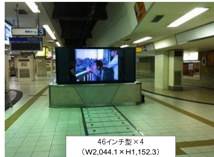
46インチ型 × 4 (W2,044.1 × H1,152.3)