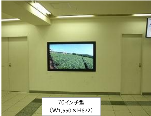
70インチ型 (W1,550 × H872)