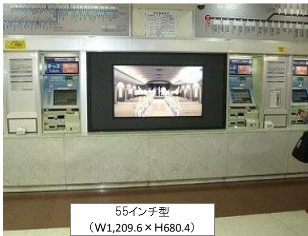
55インチ型 (W1,209.6 × H680.4)